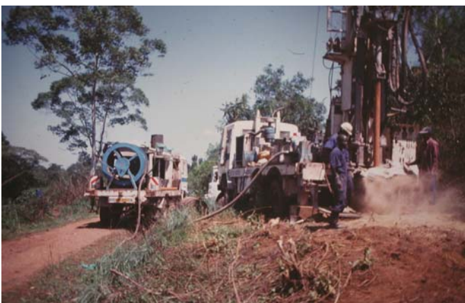
Die zweite Brunnenbohrung verlief erfolgreich. Der Brunnen ist sehr ergiebig und das Wasser hat eine gute Qualität