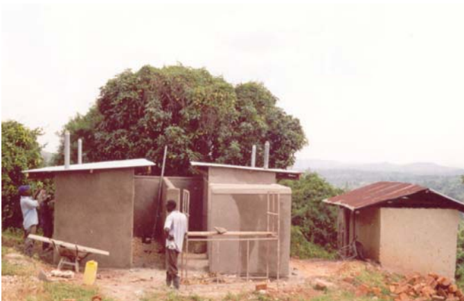
Arbeiter beim Latrinbau für die Volksschule in Kabule (Außenstation der Pfarre Kyengeza)