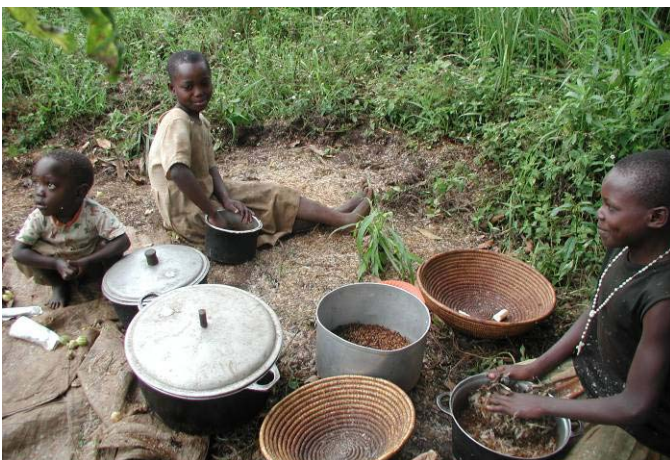
Ugandische Gaumenfreuden Die Nachbarskinder bereiten sich eine ugandische Delikatesse zu – Ameisen!