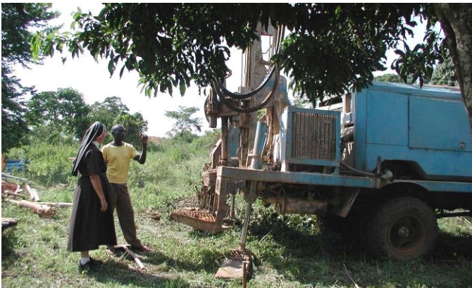
Wasser ist Leben Brunnenbohrmaschine