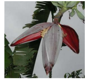
Blüte eines Matooke = Kochbananen. Sie sind das Hauptnahrungsmittel der Bevölkerung.