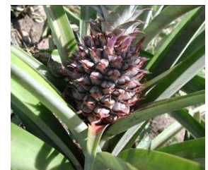
Ananas aus dem eigenen Garten. Aus dem einfachen Agavengewächs bildet sich in der Mitte die wohlschmeckende Frucht.

Marienschwestern vom Karmel, Friedensplatz 1, 4020 Linz - Tel.: 0732/775654 - Fax: 0732/775654-21 E-mail: mutterhaus@marienschwestern.at - www.marienschwestern.at