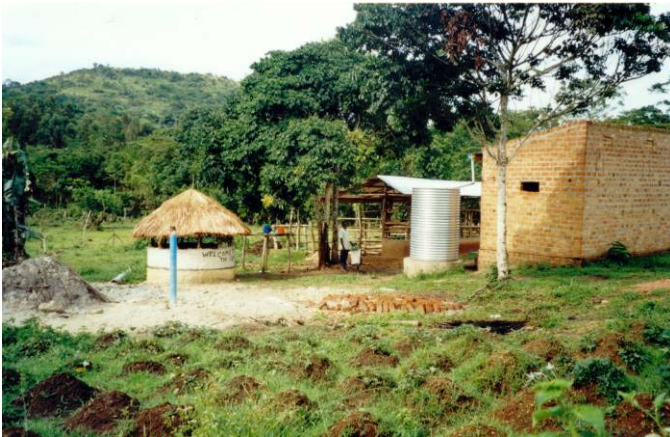
Lutabageni – Farm Ein Beitrag zum eigenen Lebensunterhalt. Im Vordergrund frisch gepflanzte Süßkartoffel.