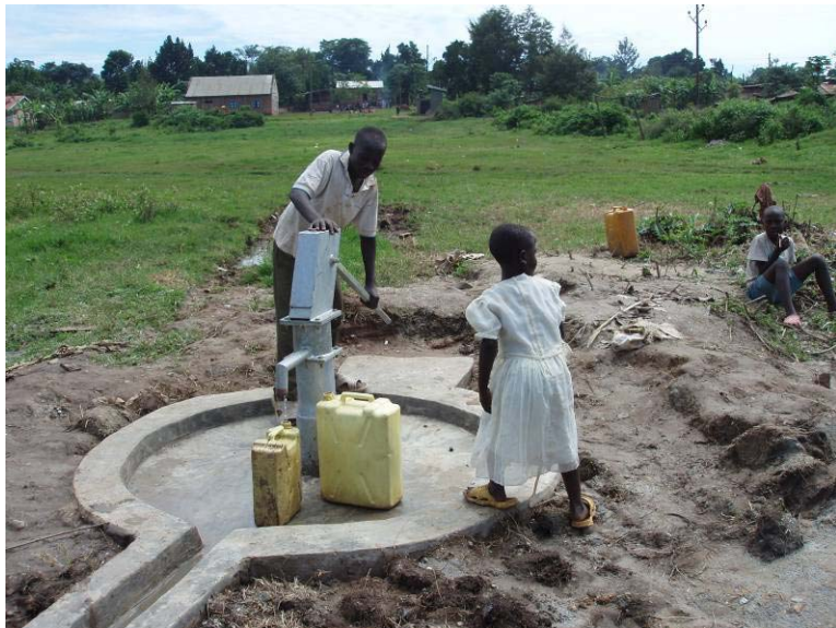
Brunnen - ein Ort des Lebens und der Begegnung!