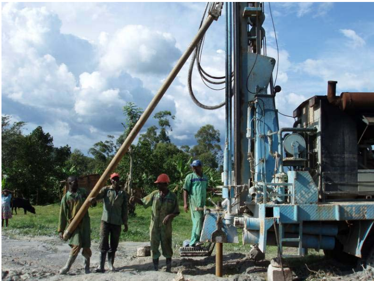
Brunnenbohrung: Ein Rohr nach dem anderen wird mit Hilfe dieser Brunnenbohrmaschine in das Erdreich gedreht. Es muss oft 90 Meter und weiter in die Tiefe gebohrt werden.

Für uns selbstverständlich, für viele Menschen in Uganda eine unerreichbare Kostbarkeit. Mit Hilfe von Spenden aus der Heimat können Brunnen-Projekte umgesetzt werden, die eine weit reichende und nachhaltige Wirkung haben.