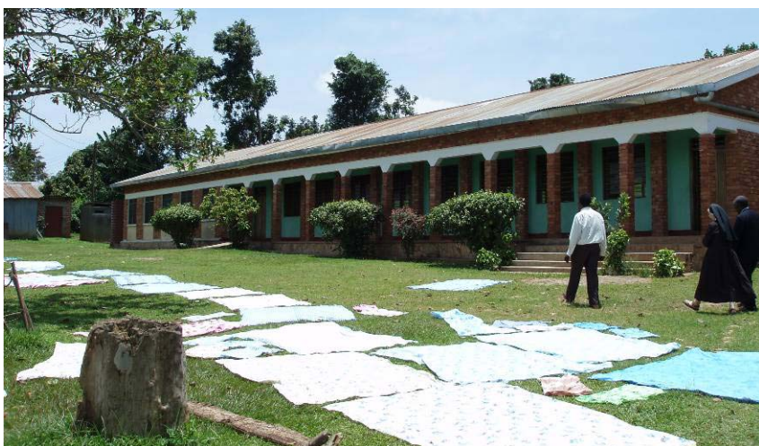
Bild oben: Das Gebäude in Mizigo - Bild unten: Vortragssaal im Gebäude