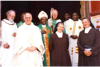
Beginn in der Pfarre Kyengeza, Nov. 2003

„Er sandte sie zu zweit voraus in alle Städte und Ortschaften, in die er selbst gehen wollte.“ (Lk 10,1)