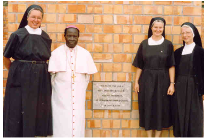
Grundsteinlegung zum Konventgebäude, 12. Juni 2004