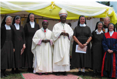
Segnung des Konventgebäudes, Nov. 2005