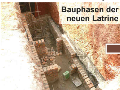
Bauphasen der neuen Latrine

... steht an: Kürzlich wurden die zwei PCs der Schule gestohlen. Die Diebe hatten es leicht. Das Gelände ist offen und die Räume können hier nicht so einbruchssicher verschlossen werden. Es ist hier üblich, Schulen oder andere öffentliche Einrichtungen mit einer Mauer zu umgeben. Ich möchte die Schule bei der Errichtung einer Einfassungsmauer unterstützen. Sr. M. Edith Staudinger