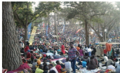
Oben: Millionen Menschen versammelten sich in Namugongo. Unten: Konzelebration beim Festgottesdienst.