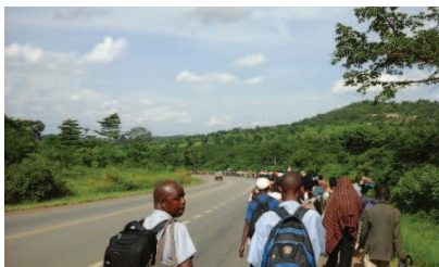
Oben: die Pilgerscharen auf dem Weg nach Namugongo. Unten: Die Diözese Mityana bereitete das Fest vor.