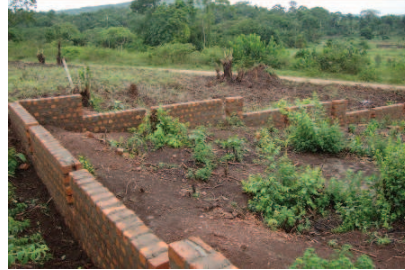
Oben und unten: Etappen bei der Errichtung des Zaunes.