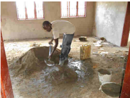
Bild unten: einer der Arbeiter beim Mörtel mischen für den Innenputz ohne Mischmaschine.

Bild oben: Gebäudeansicht von der unteren Seite. Ende September war der Außenputz großteils fertig und die Fensterrahmen eingemauert.