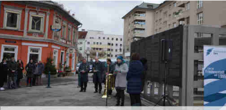
Feier am Friedensplatz, 10. Dez. 2018

Alle Menschen sind frei und gleich an Würde und Rechten geboren.