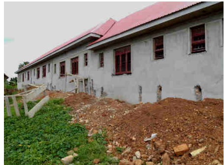
Bild oben: Gebäudeansicht von der unteren Seite. Ende September war der Außenputz großteils fertig und die Fensterrahmen eingemauert.

Bild oben: Außenarbeiten am unverputzten Haus, um Nässeschäden in der Regenzeit vorzubeugen, Stand: Anfang September 2018