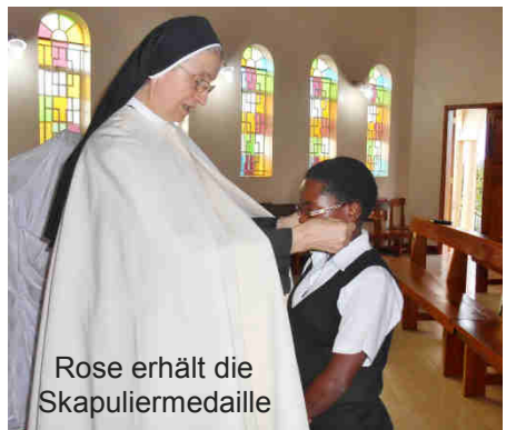
Rose erhält die Skapuliermedaille