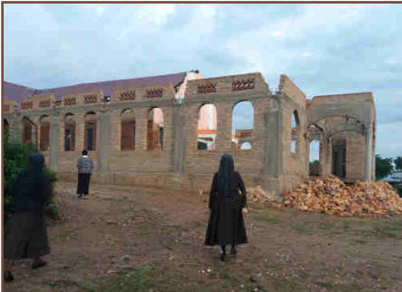
Mitschwestern auf dem Weg zur Messe.

Ich habe seinen weiteren Weg verfolgt und sein Geschäft besucht. Es bestand aus einem schmalen Gang, an dessen Ende sich ein versperrter Hauseingang befand. In den Regalen hatte er Utensilien für Installationsarbeiten lagernd. Da wegen der Lage an der Hauptstraße die Miete sehr hoch war, musste dringend eine Lösung gefunden werden.