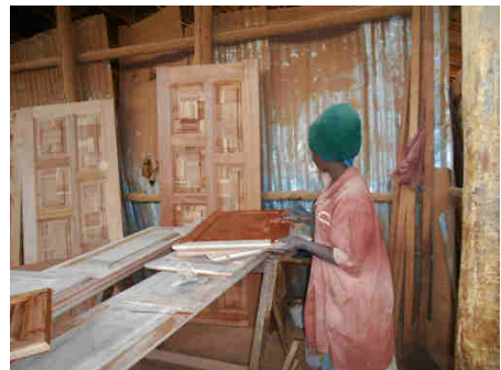
Bild unten: bildlicher Eindruck von der Tischlerei, welche die Möbel anfertigt wird.