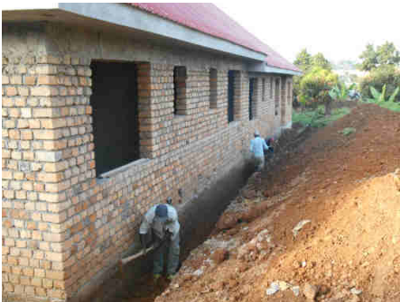
Bild oben: Außenarbeiten am unverputzten Haus, um Nässeschäden in der Regenzeit vorzubeugen, Stand: Anfang September 2018