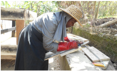
Sr. Monika konstruiert ein neues Hühnerhaus.