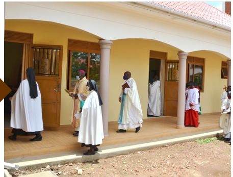
Bild unten: abschließend wurden die Räume des Gästehauses gesegnet.