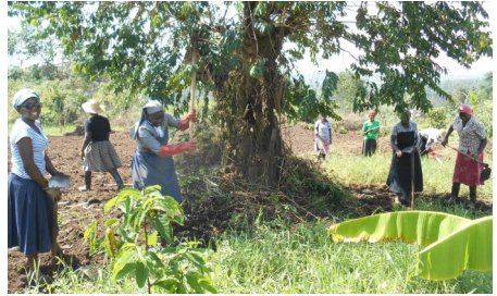
Arbeit macht hungrig! Kandidatinnen im Garten - für eine gute Ernte!