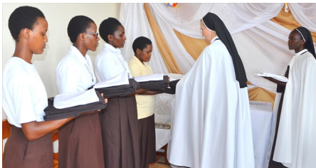
Der Habit erinnere dich, dass du in Gott zu Hause bist (Liturgie).