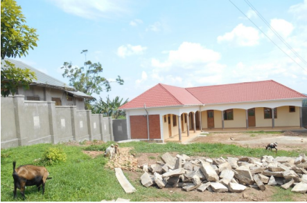
Natursteine wurden zur Befestigung von Parkplätzen weiterverwendet.