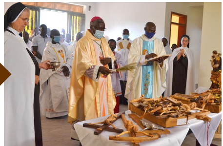
Bild oben: Zunächst segnete Bischof Zziwa die Kreuze und Statuen.