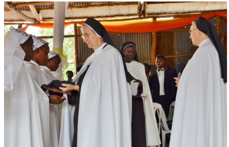
Sr. Michaela übergibt den Novizinnen die Professzeichen.