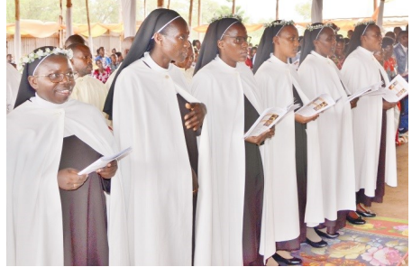
Im Lied „Großer Gott, wir loben dich“ klang die Freude dieses Festes auf.