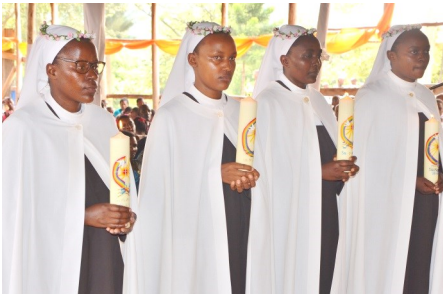
Mit brennenden Kerzen - die Novizinnen sind bereit für ihre erste Profess.