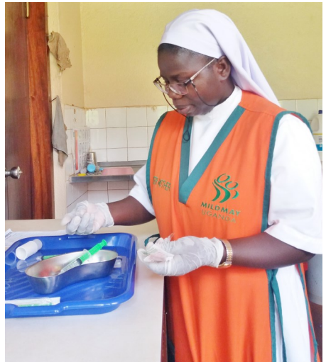
Es wird ihr bereits viel Verantwortung übertragen.