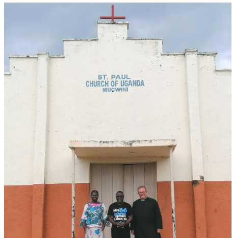
In dieser Kirche wurde Erzbischof Janani Luwum getauft.